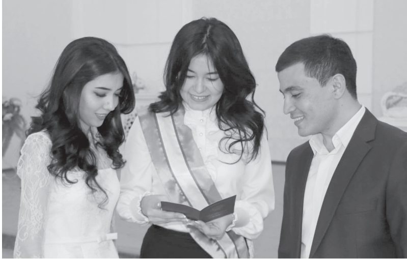
Соғлом никоҳ учун